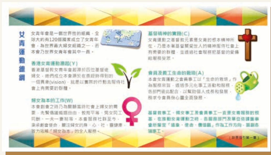
女青運動總綱，摘自 2016 年出版的《女青運動工作指引》。

女青既是機構，又是運動，既務實地為社會各階層提供多元的社會服務，同時組織架構歡迎每位接觸對象加入成為女青運動的伙伴，積極組織會員網絡、培育義工，更鼓勵合適的會員成為女青委員、董事，一同策劃及推動女青的發展。