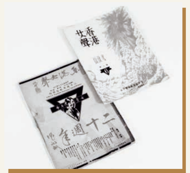
《香港女聲》月刊，以基督教立場正視社會問題。

女青是一個「運動」，同樣重要的是，女青同時是一個體制龐大的組織，一個有不同類型社會服務單位的「社福機構」。兩者之間如何同步，仍是一項挑戰。作為運動，女青需要培育運動參與者具備對社會現況的批判意識，令參與者能夠建立清晰的行動目標。運動使命的承傳，需要參與者的自覺與委身，可是最終能回應運動使命的往往只是少數。社會運動團體多以使命、遠象來招聚參與者就共同關注的議題尋求社會改