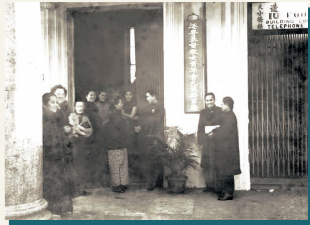
1939年創辦港粵基督教女青年會九龍辦事處，設於九龍彌敦道。

十九世紀初，有關婦女權益的思想從西方傳播到東方，為女青年會運動在中國扎根播下種子。1890年，中國第一所女青年會學校——弘道女中——在杭州成立，1908年中國第一個城市的女青年會則在上海成立，之後，各大城市及鄉鎮亦相繼成立女青年會，包括廣州、天津、成都、北京、南京、杭州、武漢、廈門和西安等。香港基督教女青年會（Hong Kong Young Women's Christian Association, Y. W. C. A.）於1918年籌備，1920年正式成立，為中國第七個市會。