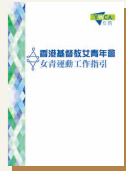
女青2016年出版的《女青運動工作指引》，旨在向女青同工介紹女青運動的介入和實踐。

其實三、四十年代，香港社會還是很封閉，沒有太多女性出來做義工，但我們當年好前衛，反[納]妾，還搞抗日救亡運動，不是只有男人才會關心國家大事，我們一班女性同樣都好愛國。 2