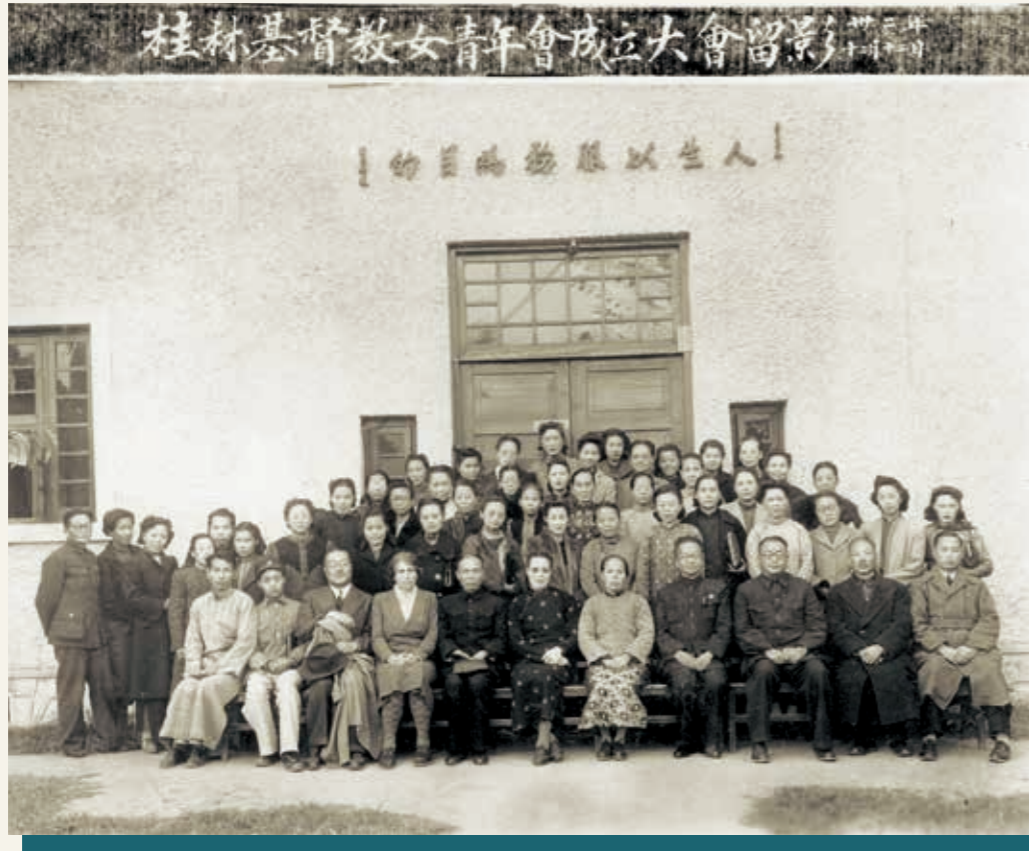
桂林基督教女青年會成立大會留影

1923年，中華基督教女青年會全國協會宣告成立，總辦事處設於上海，其時全國已有12個城市女青年會及80多個校會。《廣州基督教女青年會成立一百周年紀念特刊(1912-2012)》中有以下記載：「1938年8月廣州淪陷，本會（即廣州女青年會）遷往香港，承香港男青年會撥借九龍會所一部分為辦事處，並與香港女青年會合組穗港聯合辦事處，集中人力物力組織隨軍服務團，徵集衣物藥品運往戰區。該年，隨着會員遷澳門者日多，本會駐香港九龍辦事處分設辦事處於澳門新馬路，1941年12月，香港淪陷，本會駐香港九龍辦事處董事幹職相繼內遷。」